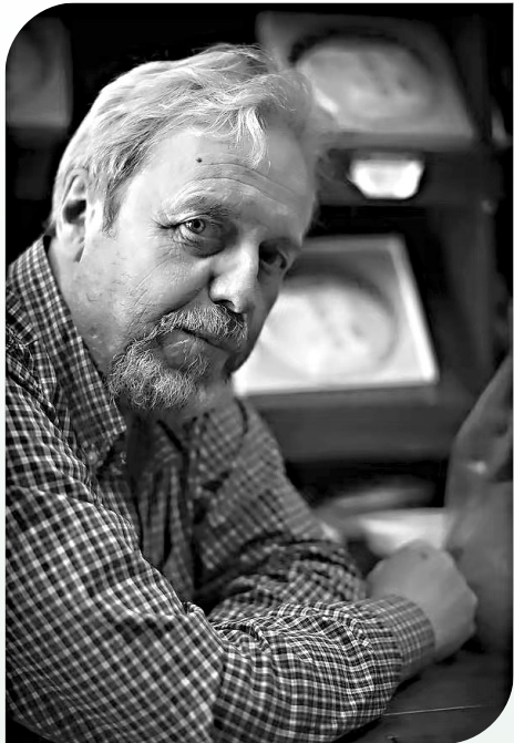
弗拉基米尔·维亚切斯拉维维奇·马良文,俄罗斯高等经济研究院亚洲区域部教授,知名汉学家,曾就职于莫斯科罗蒙诺索夫大学、巴黎大学、远东联邦大学、中国台湾淡江大学等教学和科研单位,先后出版50余部专著。

同体观念和费孝通的“多元一体”理论相似,但更注重文明之间的互动及其变化,为困顿中的全球化模拟了出路。他告诉我们:真正的互联互通不仅是货物与资本的流动,更是“天人合一”智慧与“协同共存”伦理的价值共鸣。《欧亚与全球性》或许尚未构建完整的理论体系,但其打破学科边界的勇气、贯通古今的视野、融合欧亚文明的尝试,特别是对中国文明的深入理解,使之成为中俄文明互鉴的典范。当下我们更需要和平对话,而不是冲突纷争。欧亚大陆的精神整合和协同合作,或许正是构建人类命运共同体的密码。 (作者系河南大学俄罗斯研究中心副教授)