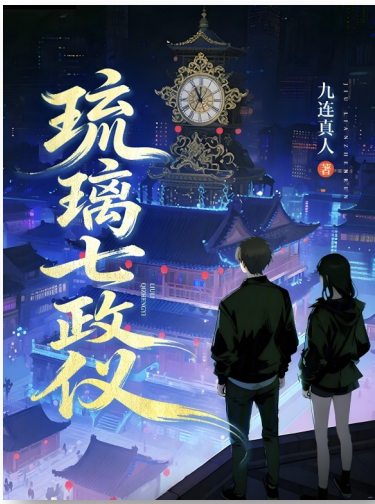
《琉璃七政仪》，九连真人著，首发于起点中文网