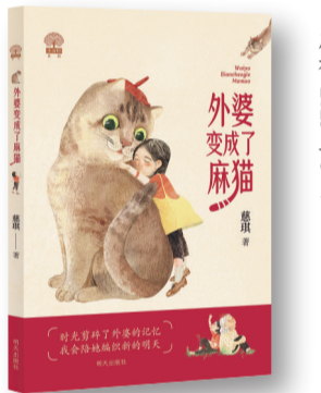
《外婆变成了麻猫》,慈琪著,明天出版社,2023年5月

小时候,我从故事里翻出过钉子、徽章、蚯蚓、潮虫、化石和骨头,翻出过无数经验和情感的宝藏,它们使我变得敏感且强壮。现在轮到我来埋宝藏了,把日记、卡片、笔芯、蚕茧、药瓶和绷带埋进更新鲜的故事,等着更小的孩子来翻。我很喜欢这个游戏,玩得很开心,希望大家也是。