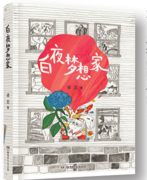
《白夜梦想家》,诺亚著,湖南少年儿童出版社,2024年10月

与孤僻,肯定了她存在的意义之时,我似乎终于明白了,许多年后当我回望过去时,我会看见什么。由此,我也终于懂得自己遇见儿童文学的意义:我为自己造了一座房子,我是我的父母、兄弟、姐妹,我是我的朋友、我的猫或者我的狗,我是我的全世界。人必须先爱自己,才能爱别人;人必须先救赎自己,才可安慰别人。我为自己造了房子,也为别人造,或者在他们需要造房子的时候递去几块砖。然后有一天,我们每个人的童年都有自己的安置之所,这也是我最大的祝愿。