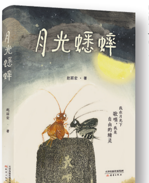
《月光蟋蟀》,赵丽宏著,新蕾出版社,2023年1月