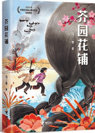
《芥园花铺》,马三枣著,接力出版社,2025年8月