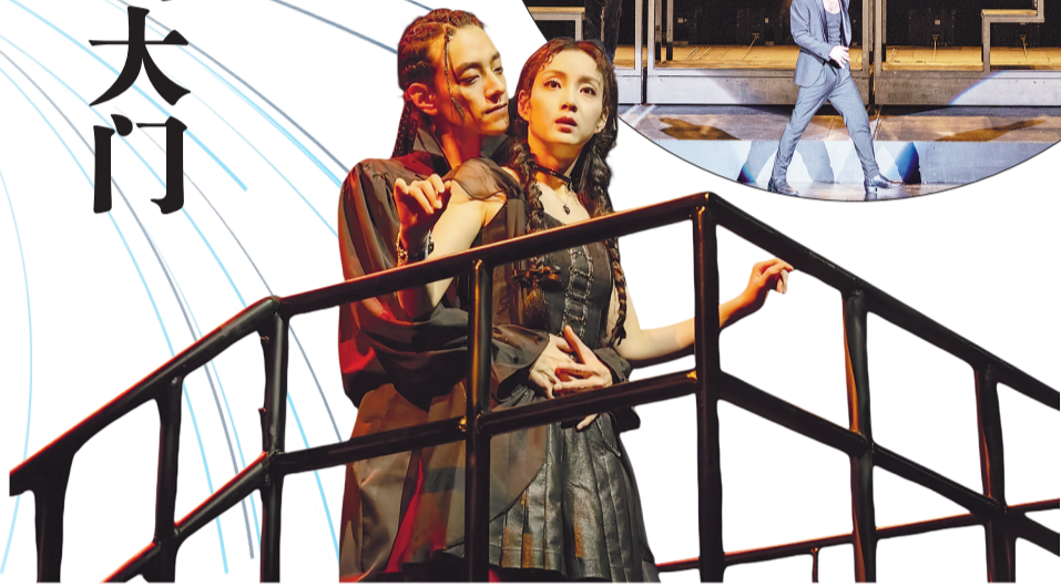
《三分钱歌剧》剧照