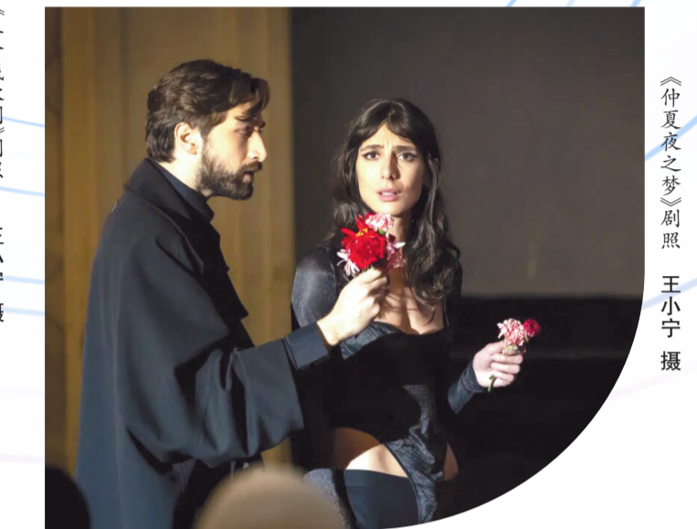
《仲夏夜之梦》剧照

式的《茶馆》、各种解读的《雷雨》,但依然要保留老《茶馆》、老《雷雨》的风格样式,因为它们就是我们的“镇院之宝”。从这点上来说,人艺在经典剧目复排方面是有所选择的,有些戏必须“原汁原味”,有些戏则可以重新排演、创新性地表达。对年轻演员来说,学习和传承前辈艺术家赋予角色的精神气质,有时甚至比创新还难。但我们要等他们成长、给他们舞台,通过复排搭建起一座演员通向人艺历史与经典的桥梁。同时也期盼观众能借助这些经典剧目,洞察人艺在传承、创新之路上的不懈探索与努力,更加热爱戏剧艺术,与人艺建立起更深的情感纽带,让人艺能在这份信任中笃定前行,不断焕发出新的生机与活力。