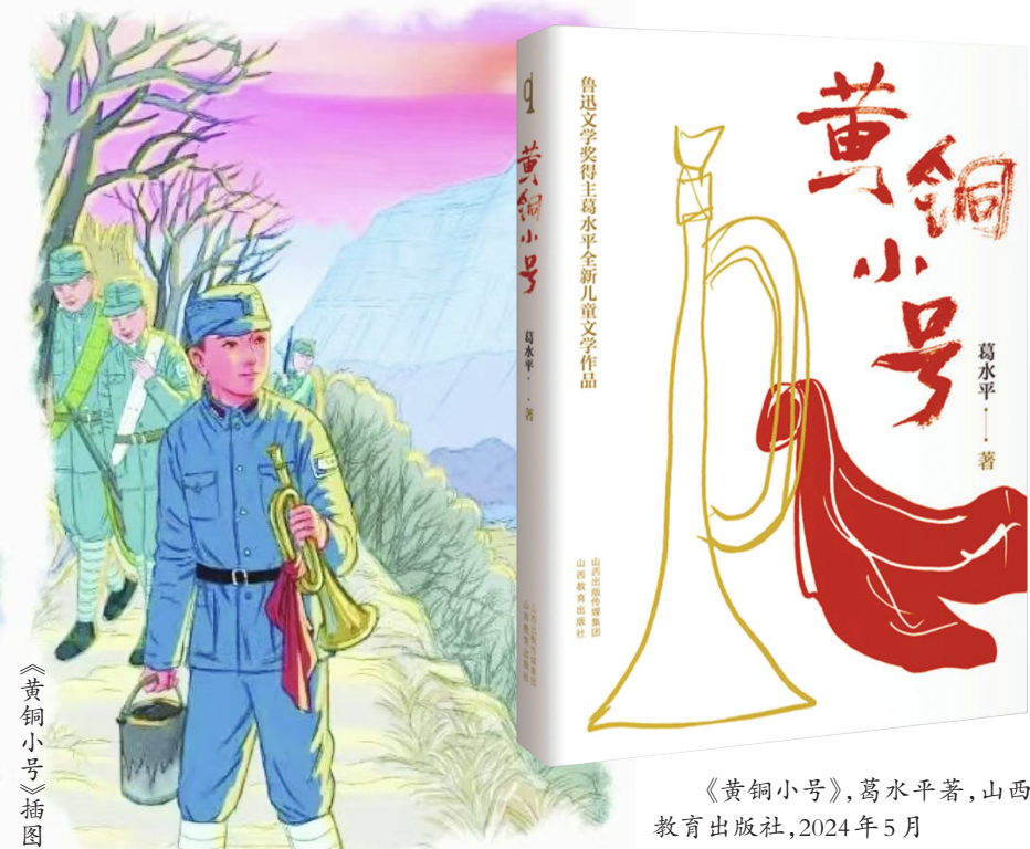
《黄铜小号》，葛水平著，山西教育出版社，2024年5月

在方教导员、王联防营长等人的循循善诱下，崔振芳逐渐从狭隘的复仇情感中走出，开始理解“军号”承载的集体意志与民族使命。当他在鸡冠山悬崖上对着绝壁吹奏小号，“用劲吹时脑海里就会变幻出五颜六色的光芒”，这不仅是吹号技巧的磨炼，更是精神世界的洗礼。他最终认清“军号不只是乐器，更是责任与担当”，当冲锋号响起，小号成为“千军万马的指挥棒”，成为凝聚士气、指引胜利的“武器”。这种从“乐器”到“武器”的符号裂变，从“个体仇恨”到“集体责任”的认知升华，相较于传统抗战儿童文学中“少