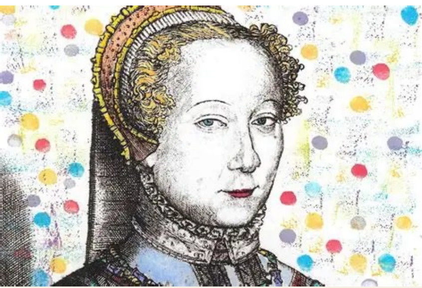
路易丝·拉贝肖像 路易丝·拉贝1524年出生于里昂,是“里昂诗派”的代表人物之一

20世纪40年代,阿尔贝·加缪离开阿尔及利亚后曾在里昂短暂逗留了几个月。1943年1月17日,加缪在朋友帕斯卡·皮亚的陪同下,第一次见到了弗朗西斯·蓬热。此前,早在1941年,当蓬热读到加缪《西西弗的神话》的书稿时,对其中的荒诞主题深感共鸣,就很想结识作者。次年,蓬热出版了《采取事物的立场》,加缪出版了《局外人》。两人一见如故,而后多有书信往来,2013年这些信件结集成册,命名为《书信(1941—1957)》,由伽利玛出版社出版。加缪《局外人》第一版印刷了4400册,他将其中一本签名本送给了好友勒内·莱诺。莱诺在里昂出生,是《进步报》的诗人和记者,也是里昂抵抗运动的代表人物。加缪在里昂时寄宿在莱诺家,两人因此建立了深厚的友谊,莱诺家所在的街道后来也被更名为勒内·莱诺