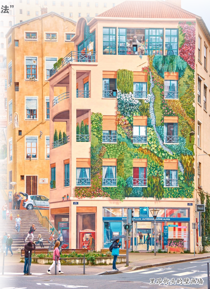
里昂街头的壁画墙