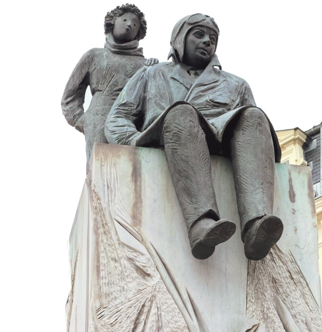
作家安托万·德·圣-埃克苏佩里的雕像 他于1900年生于里昂,为了纪念他,里昂市中心白莱果广场的西南角矗立着一座他与小王子的雕像,他出生的街道也以他的名字命名