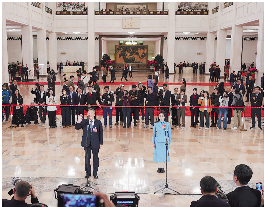
3月9日,第十四届全国人民代表大会第四次会议第二场“代表通道”集中采访活动在北京人民大会堂举行。