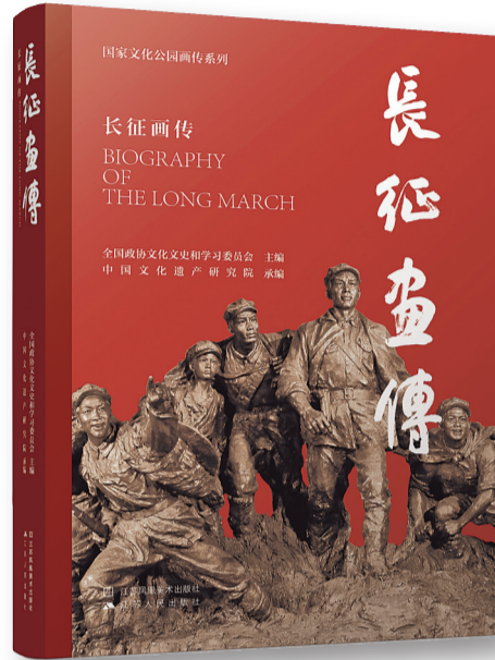
《长征画传》,全国政协文化文史和学习委员会主编,江苏凤凰美术出版社、江苏人民出版社,2025年2月

今年是中国工农红军长征胜利90周年。90年来,这段跨越千山万水的征程从未在我们的记忆中褪色,反而因其蕴藏的磅礴精神力量,成为一座愈掘愈深的富矿,一部常读常新的大书。长征是惊天动地的革命壮举,是中国共产党和红军谱写的壮丽史诗,是中华民族伟大复兴历史进程中的巍峨丰碑。