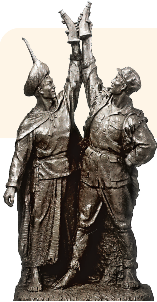
红军和彝族兄弟(雕塑) 许章衡作 中国国家博物馆藏

长征是人类历史上的伟大奇迹,是中国共产党人和红军将士用生命和热血铸就的不朽丰碑。长征精神作为中华民族弥足珍贵的精神财富,穿越时空,历久弥新,激励着一代代中华儿女砥砺前行。《长征画传》作为“国家文化公园画传系列”的重要作品,以细腻厚重的笔触勾勒出长征的全貌。透过那些珍贵的历史画面和感人至深的故事,我们得以领悟“革命理想高于天”的信仰力量,汲取不畏艰险、勇往直前的精神力量。