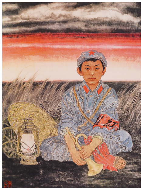
红军小战士(局部) 于文江作