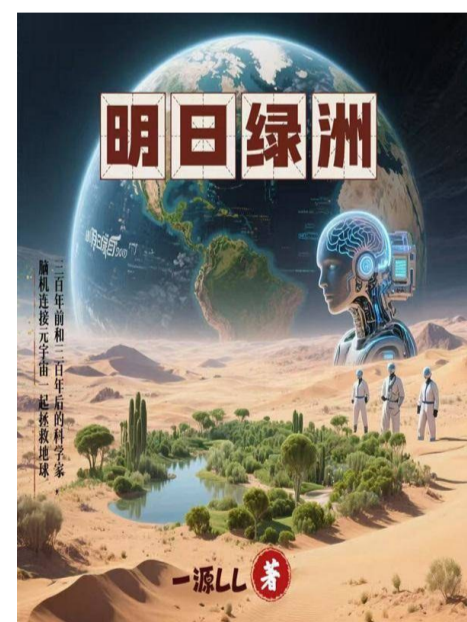
《明日绿洲》,一源LL著,首发于七猫中文网

家族打造的元宇宙社区是麻痹人类的精神鸦片,民众沉迷于虚拟的美好生活,对现实中的土地沙化、水资源被掠夺、阶层固化视而不见,本质是科技垄断阶层对民众的精神控制。