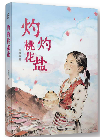
《灼灼桃花盐》，席莹莹著，江苏凤凰少年儿童出版社，2026年3月

梅朵说：“困难是软欺怕硬的怪兽。你越怕，它越凶；你不把它放在眼里，它反而会怕你。”这