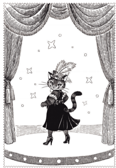
《万松浦群猫英雄谱》插图