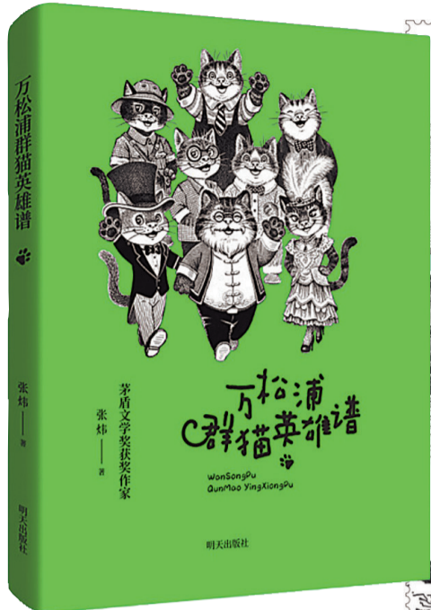
《万松浦群猫英雄谱》，张炜著，明天出版社，2026年1月

猫托邦，以猫为本，以人为挚友，以万物为基底。万松浦猫托邦里的猫们不同于艾略特笔下的猫，大部分是土生土长的中华田园猫，有橘猫、狸花猫、奶牛猫、黑猫。它们拥有自己的名字：“黑火腿”“小红孩”“老铁板猫”“斗眼猫”“势利眼猫”“院长宝贝猫”“外交官猫”“遍尝百草猫”“老航海猫”……这些个性十足的命名，或因形象气质，或来自性格特征，或出于命运传奇，既还原了猫的猫性，又在诗人的想象力之下完成了新的有意味的塑形。万松浦群