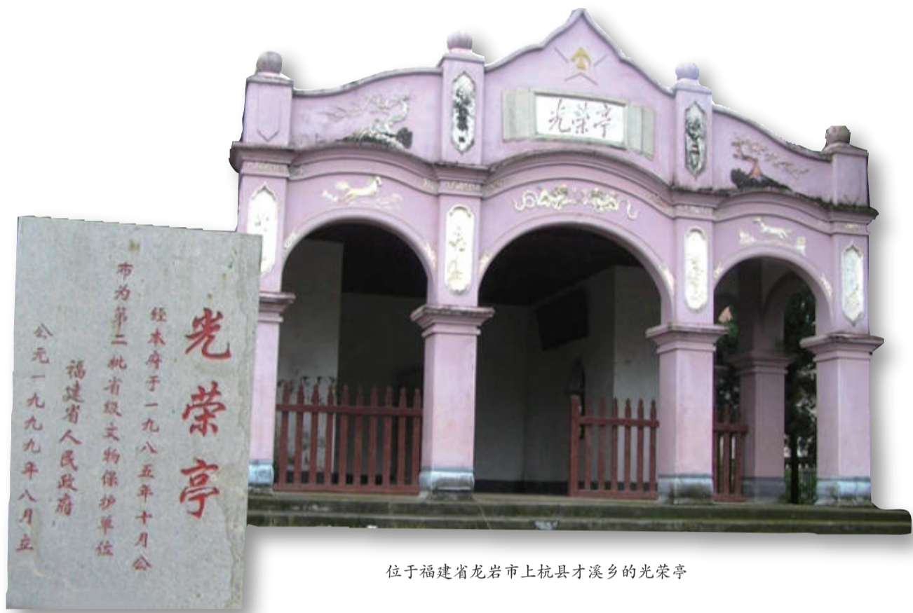
位于福建省龙岩市上杭县才溪乡的光荣亭

第三,作品以小切口、小细节反映日常,注重以人为本的创作理念,通过生动且富有表现力的场景和细节,讲述民警的故事。报告文学写作离不开深入生活、扎根一线的精神,没有调查就没有发言权,没有深入的采访、没有独特的发现就没有好的报告文学作品。《光荣亭》作为福建省作协定点深入生活扶持项目作品,是一部名副其实的忠于生活、忠于真实、忠于时代的佳作。