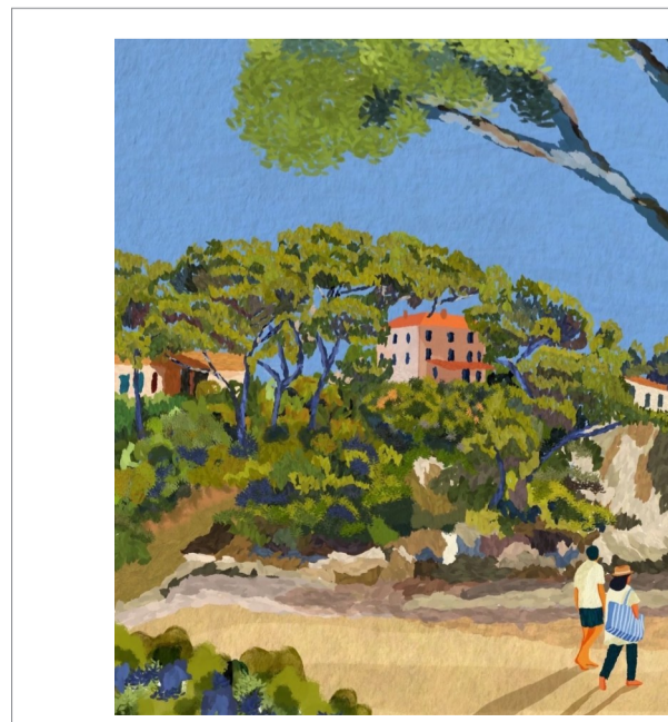
法国画家 Catherine Cortasco 作品