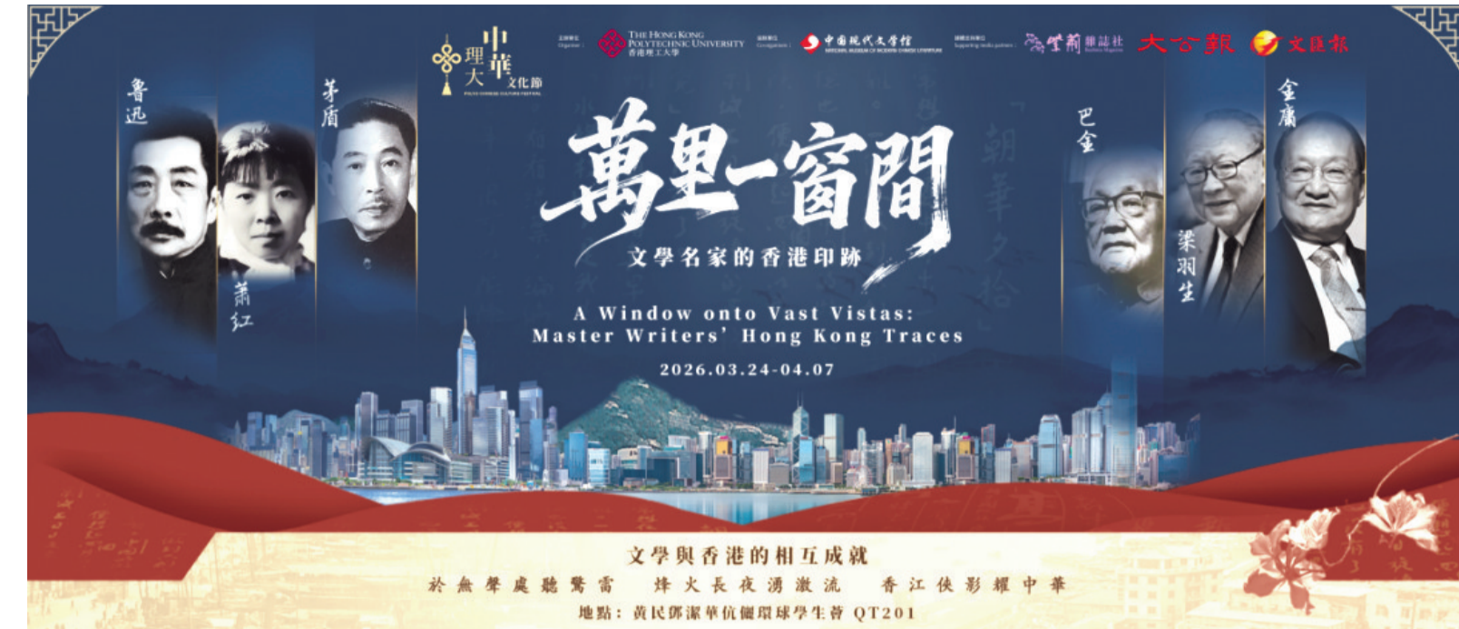
「万里一窗间」文学名家的香港印记「展览海报