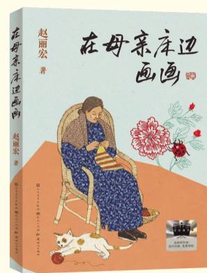
《在母亲床边画画》 赵丽宏 著 人民文学出版社 天天出版社 2026年1月出版

这是一本用画笔与文字共同写就的“母爱之书”，记录中国母亲生生不息的坚韧与美好，教给孩子对永恒亲情的信念和对生命的深刻思考。当言语无法抵达时，爱如何表达？这本书给出了动人的答案，深刻展现了亲情如何超越语言，通过共同的记忆、耐心的陪伴和绘画的形式得以传递，写尽中国式母子的含蓄与深情。