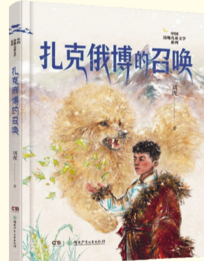
《扎克俄博的召唤》 刘虎 著 湖南少年儿童出版社 2026年1月出版

这是一部描写藏区生活与变迁的长篇小说，通过男孩路嘴一家与藏獒金狮命运交织的故事，展现了扎克俄博草原的自然生态、牧民文化与现代文明冲击下的矛盾与融合。小说以细腻的笔触描绘了藏区的风土人情，并通过人与动物、传统与现代的冲突，传递出对生命尊严与敬畏自然的深刻思考。