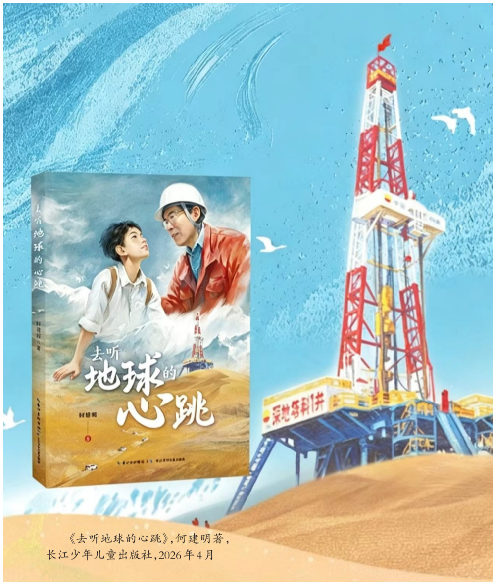
《去听地球的心跳》，何建明著，长江少年儿童出版社，2026年4月

地球心跳的声音不同于天籁，却更加难得，更加珍贵。那些声音，经过技术处理，收藏在北京中国共产党历史展览馆里，对公众开放，我们随时都可以听到。有“中国深度”，才会听到“地球心跳”，而“中国深度”是由一群普通中国人创造的，因此，作品重点在写那口叫“深地塔科1井”钻井，写那些长年奋斗在西部大漠深处的石油人。没有他们，就没有中国深度。2025年，中国钻进突破10910米难关，标志着中国石油勘探技术站到了世界领先的位置，同时也表明，中国装备制造向着制造强国迈出了一大步，引领世界制造的方向。当今世界正经历百年未有之大变局，各类风险