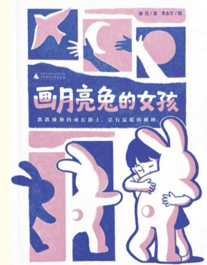
《画月亮兔的女孩》 孙昱 著 李志宇 绘 广西师范大学出版社 2026年3月出版

这是一部描写藏区生活与变迁的长篇小说，通过男孩路嘴一家与藏獒金狮命运交织的故事，展现了扎克俄博草原的自然生态、牧民文化与现代文明冲击下的矛盾与融合。小说以细腻的笔触描绘了藏区的风土人情，并通过人与动物、传统与现代的冲突，传递出对生命尊严与敬畏自然的深刻思考。