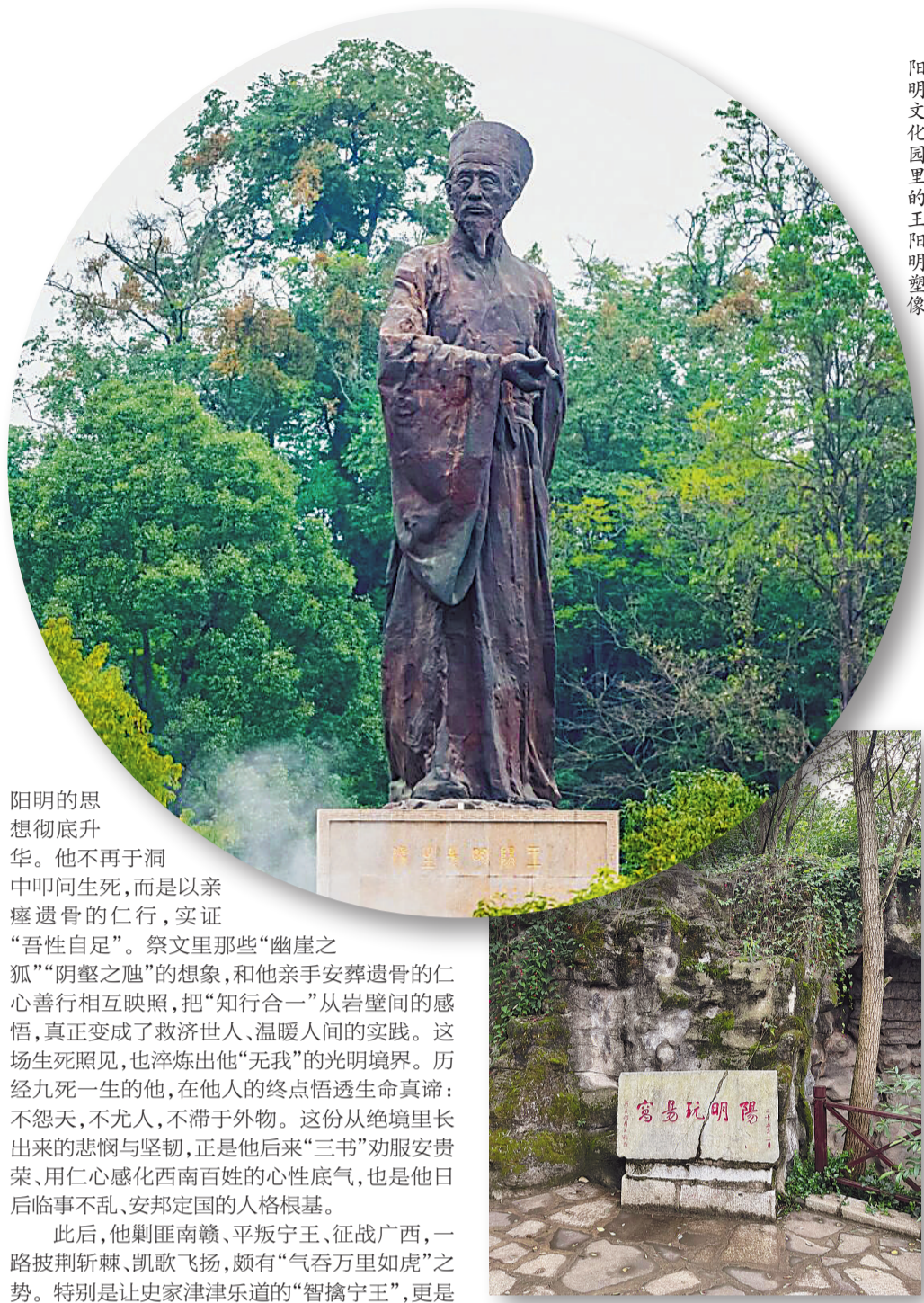
阳明文化园里的王阳明塑像

阳明的思想彻底升华。他不再于洞中叩问生死，而是以亲蹇遗骨的仁行，实证“吾性自足”。祭文里那些“幽崖之孤”“阴壑之魑”的想象，和他亲手安葬遗骨的仁心善行相互映照，把“知行合一”从岩壁间的感悟，真正变成了救济世人、温暖人间的实践。这场生死照见，也淬炼出他“无我”的光明境界。历经九死一生的他，在他人的终点悟透生命真谛：不怨天，不尤人，不滞于外物。这份从绝境里长出来的悲悯与坚韧，正是他后来“三书”劝服安贵荣、用仁心感化西南百姓的心性底气，也是他日后临事不乱、安邦定国的人格根基。