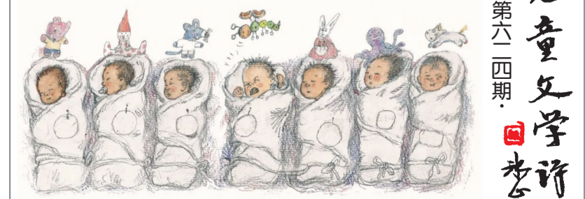
《出生的故事》插图，蔡皋绘，湖南少年儿童出版社