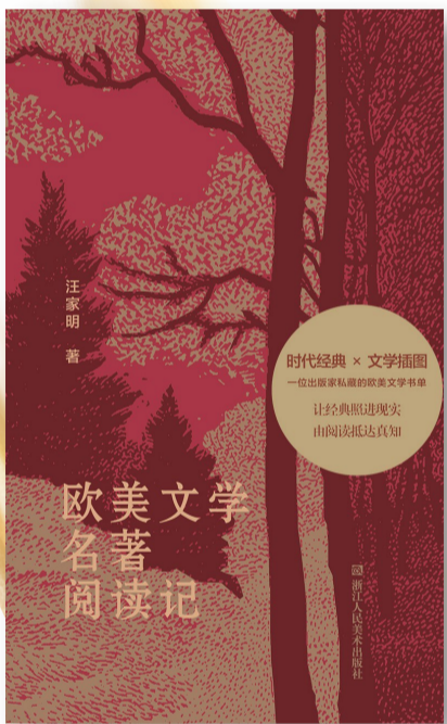
《欧美文学名著阅读记》,汪家明著,浙江人民美术出版社,2026年4月