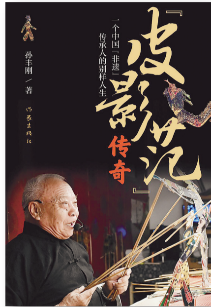
《“皮影范”传奇——一个中国“非遗”传承人的别样人生》，孙丰刚著，作家出版社，2026年5月

《“皮影范”传奇》在写人叙事中也十分注重地域风习和方言土语的文化意义，使非遗传承的审美语境变得可感可亲，既还原了场景质感，又激活了人物情感，彰显出技艺传承始终扎根深厚的文化土壤，为泰山皮影戏走出国门、走向世界提供了可溯源的密钥。此外，作品借助群像烘托的方式刻画人物，丰富故事层次，将主题深嵌到艺术化的非遗叙事中，读者在感受主人公“为人之真，做事之善，从艺之美”的同时，获得了情感共鸣。